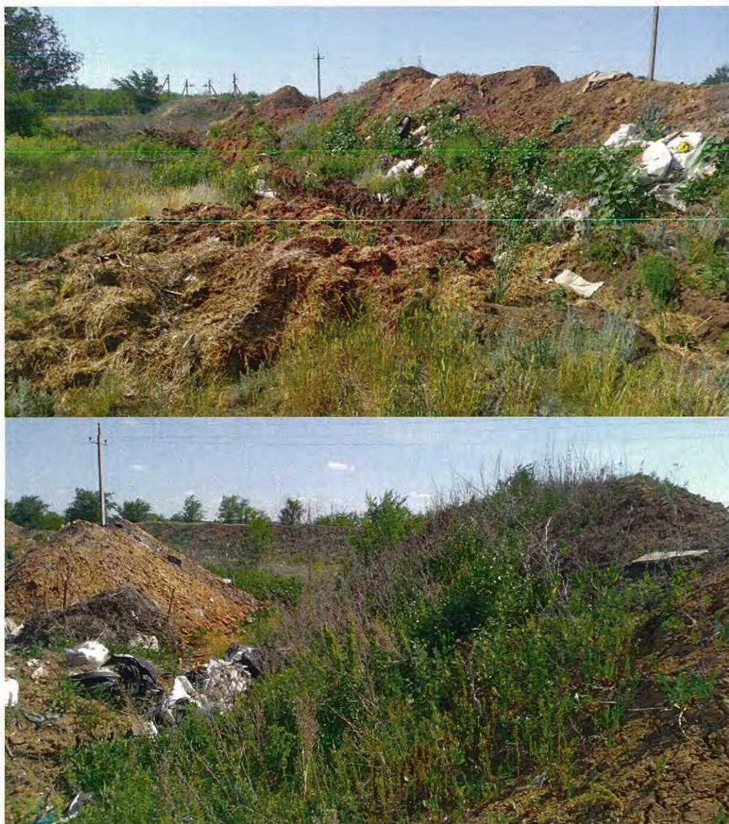
Рисунки 4, 5 – Обваловка свалки из минерального грунта и канава

- создание целостной (замкнутой) обваловки из минерального грунта высотой до 4 метров, препятствующей выдуванию отходов и захламлению прилегающей территории (рис.4, 5),