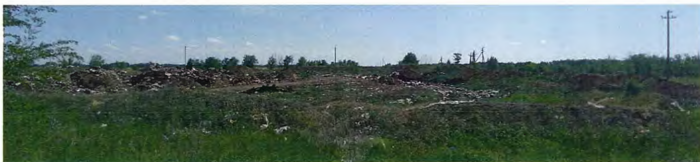
Рисунок 2 – Общий вид свалки со стороны въезда (западная сторона)

Местность пересеченная, имеет естественные и искусственные овраги/рвы/выемки, неравномерно захламлена стихийно накопленными отходами производства и потребления.