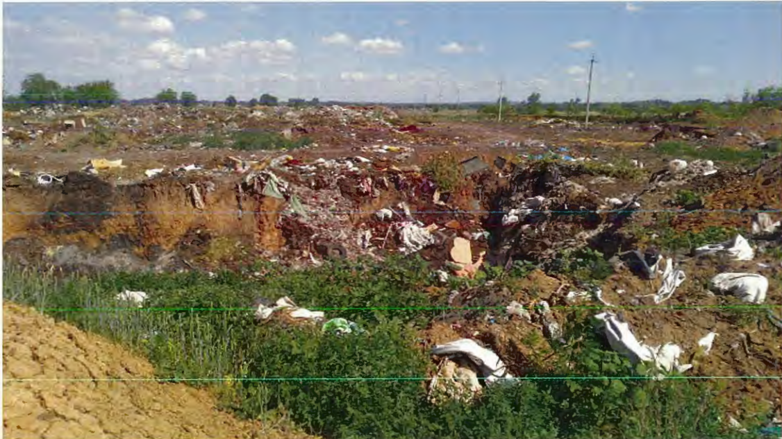
Рис.6 – Вид с обваловки юго-восточного угла свалки, центральный массив отходов спланирован и пересыпан инертным грунтом.

Исполнение работ в рамках муниципального контракта № 0153300066921000508 от 16.06.2021 предусматривает два этапа: