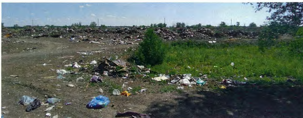
Рисунок 3 – Въезд на территорию свалки

Транспортная доступность объекта (наличие дорог с асфальтовым покрытием, близость трассы Оренбург-Илек), съезд с автомобильной дороги на свалку, при относительно близком расположении жилой застройки поселка Городище и фермерских хозяйств провоцирует население на несанкционированный привоз и размещение твердых бытовых и коммунальных отходов (рис. 3).