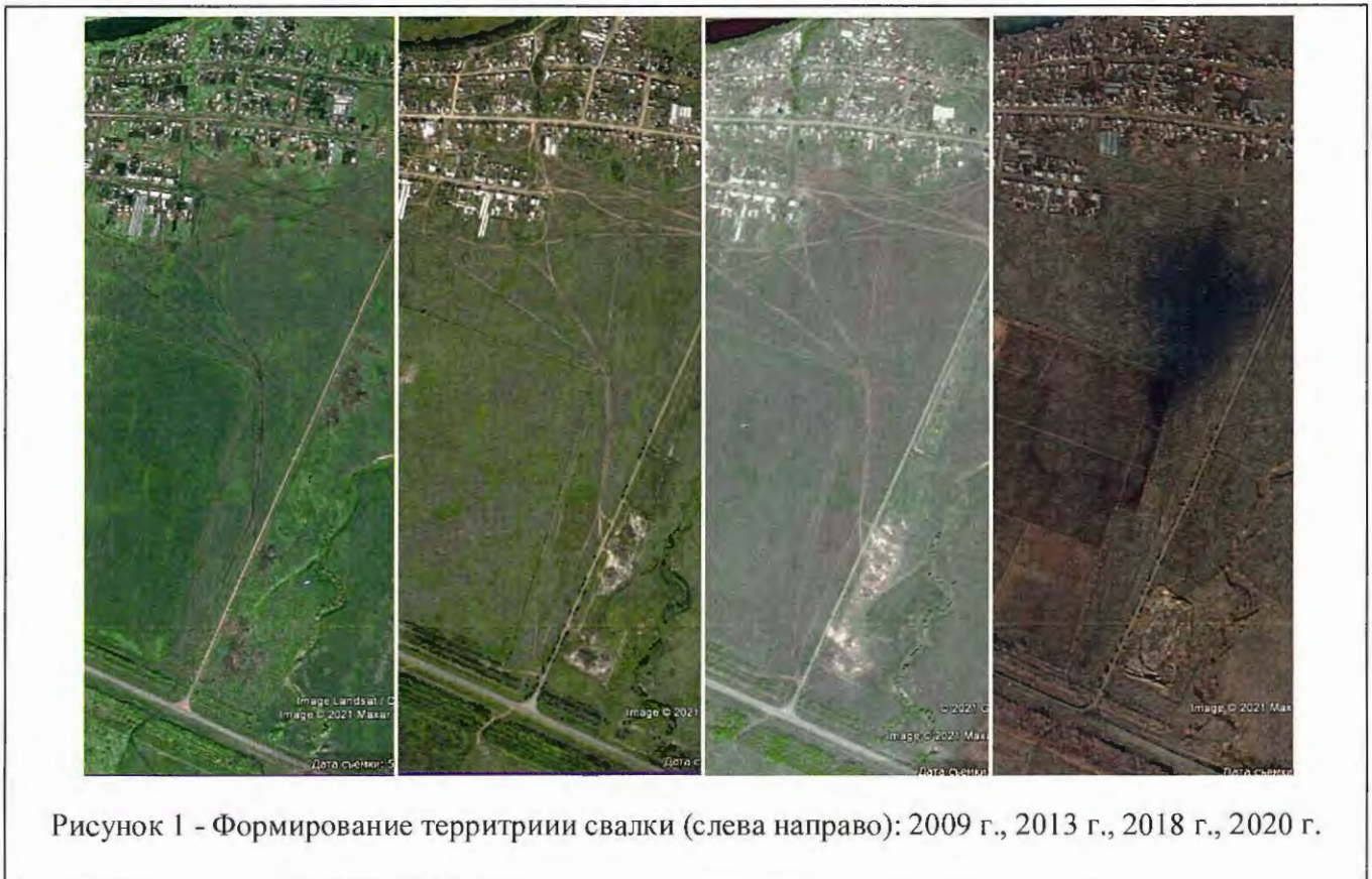
Рисунок 1 - Формирование территории свалки (слева направо): 2009 г., 2013 г., 2018 г., 2020 г.

Первоначально отходы внавалку размещались в придорожной полосе, их наличие визуально скрывалось лесными полосами, ввиду чего территория свалки бесконтрольно разрасталась. Основой отходов является мусор несортированный из жилищ и отходы сельскохозяйственного производства. По космоснимкам территории 2009-2020 г.г., в программе Google Earth, (снимки находятся в открытом доступе) (рис. 1), свалка формировалась на участке без снятия почвогрунта отдельными отвалами объемом 3-8 м 3 , затем отдельные отвалы сливались в массив, который позднее был перемещен бульдозерами для расчистки территории и формирования более компактного и пожаробезопасного объекта. По состоянию на 2020 год свалка имеет обваловку, опашку (минерализованную полосу с трех сторон), укатан грунтовый въезд внутрь обваловки.